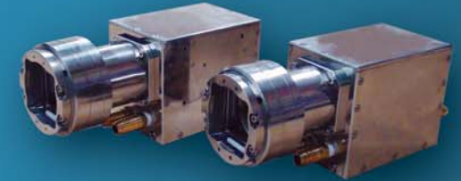
[ High Power DDL Systems ]